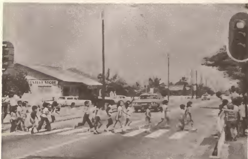
Luznan di trafico nobo na Savaneta pa mas seguridad pa chiquito y grandi.

Cu e aumento di e cantidad di autonan na Aruba, gobierno di Aruba a entama cierto proyectonan cu e meta pa mehora trafico y seguridad ariba carreteranan di Aruba.